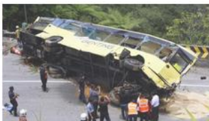
RENCANA KHAS: Wajarkan PUSPAKOM Disalahkan? In "Auto Terkini"