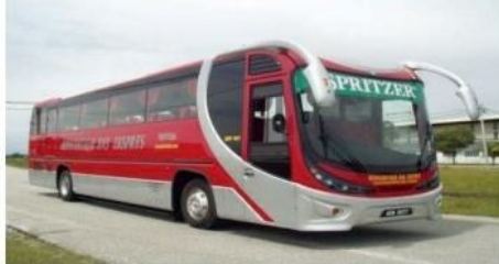
PUSPAKOM Sdn Bhd

PUSPAKOM akan mengedarkan 5,000 naskah Buku Panduan Pemeriksaan Bas terbitan khas kepada semua persatuan pengusaha bas dalam usaha memberi pendedahan berhubung piawaian pemeriksaan bas yang perlu dipatuhi.