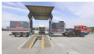
Perkhidmatan Unit Bergerak Puspakom Kini Di Daerah Maran, Mersing Dan Besut In "Auto Terkini"